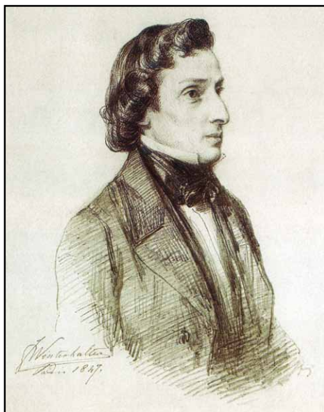
Portret Chopina sygnowany „F. Winterhalter Paris 1847”