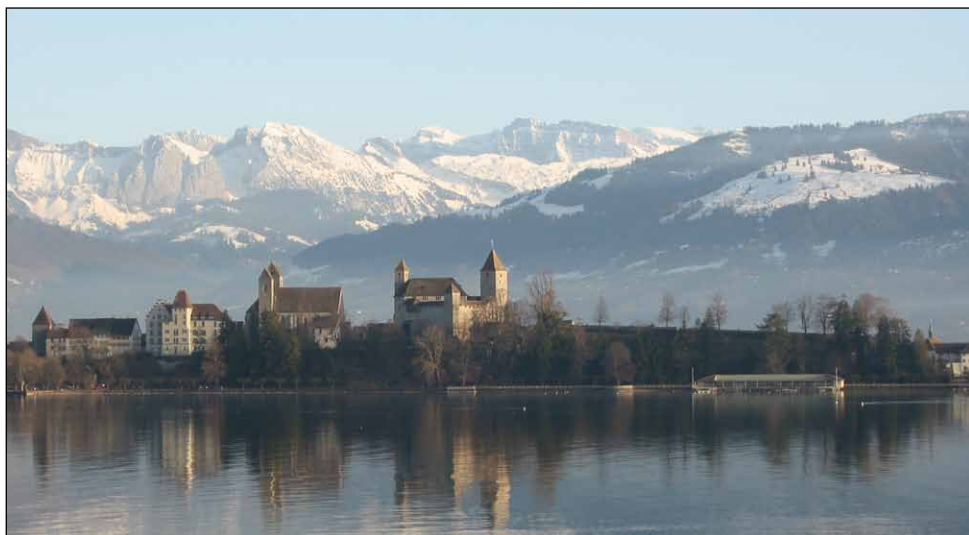
Rapperswil, widok z Jeziora Zuryskiego na fragment starówki, zamek, kościół, Alpy.

Więcej informacji na stronach: www.arturrubinstein.pl www.muzeum-polskie.org