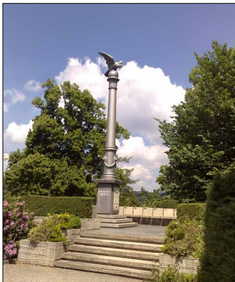
Kolumna Barska w Rapperswilu

W radzie muzealnej i we władzach fundacji „Libertas” zasiadają tak Polacy, jak i Szwajcarzy. Odnotować też należy, że Muzeum doskonale reklamuje miasteczko Rapperswil.